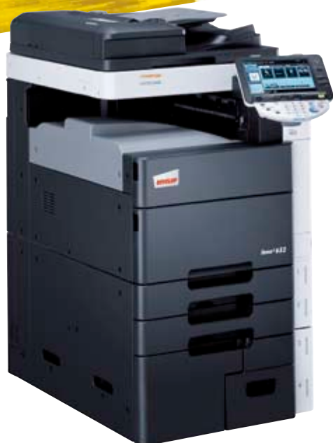
ineo+ 652 met uitvoerlade (OT-503)