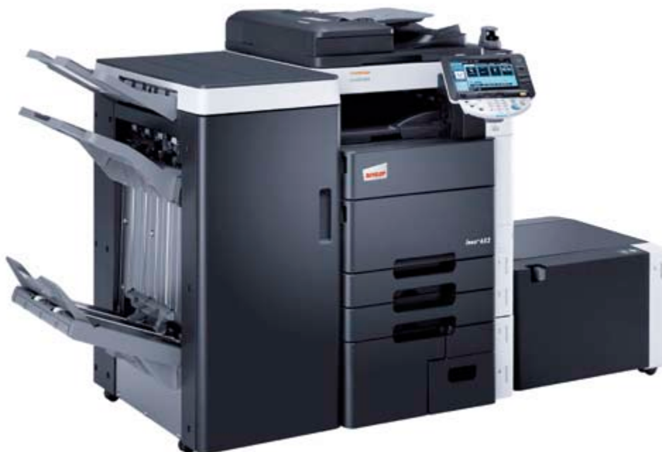
ineo+ 652 met afwerkingseenheid (FS-526), boekjes afwerkingseenheid (SD-508), werkblad (WT-506), vingeraderherkenning (AU-102) en grootvolume lade (LU-204)