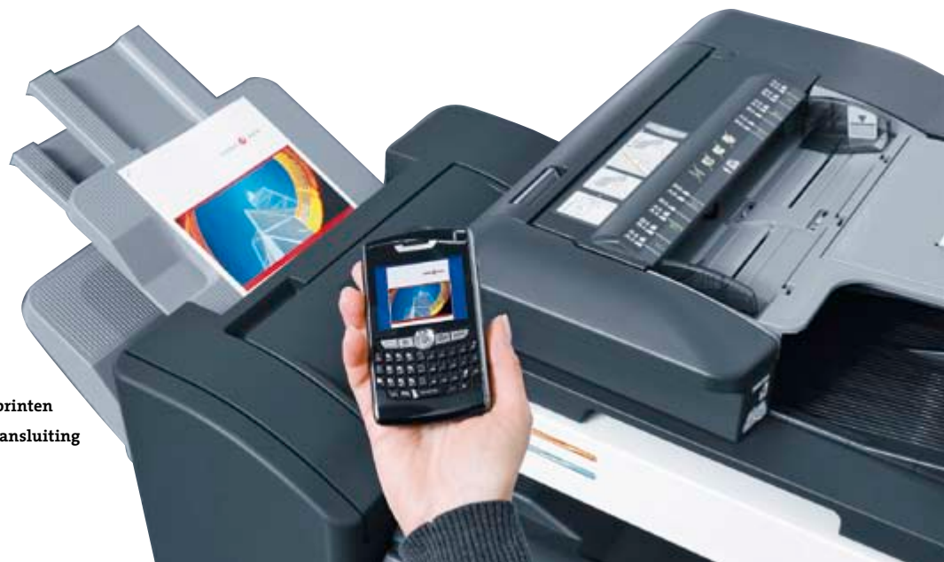
Mogelijkheid tot mobiel printen via optionele bluetooth-aansluiting