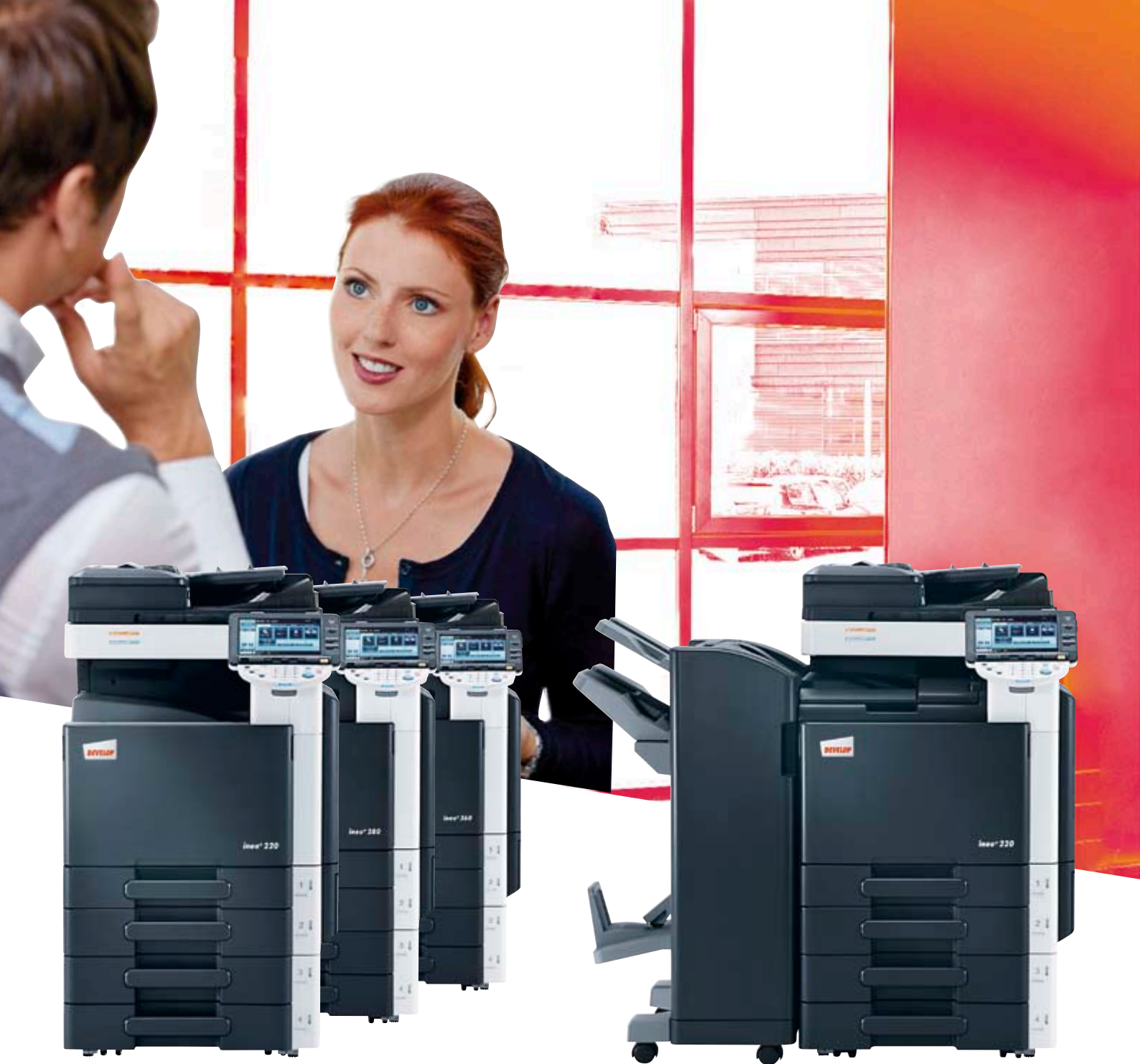
ineo+ 220/280/360 met documentendoorvoer (DF-617), interne afwerkingseenheid (FS-529) en universele lade van 2x 500 vel (PC-207)